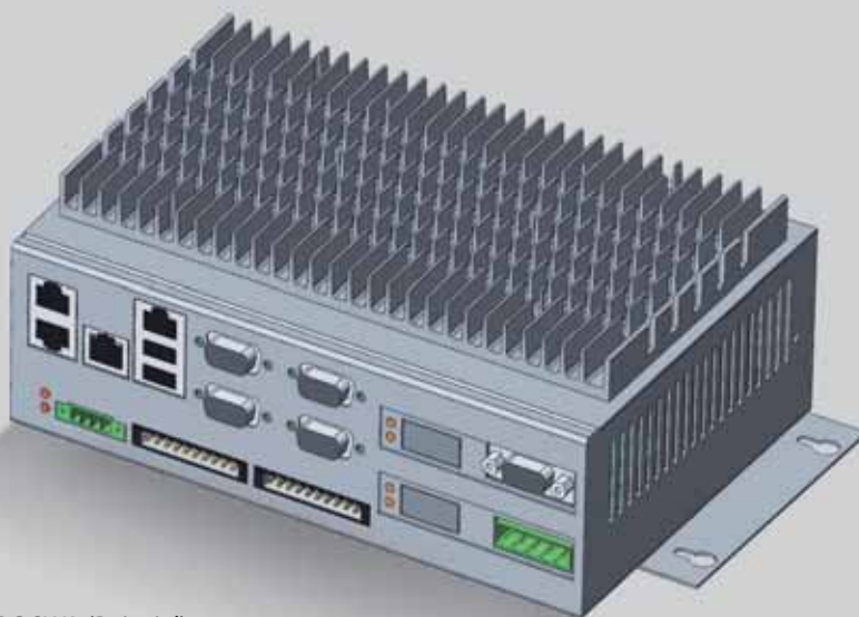
IPC SWA (Beispiel)